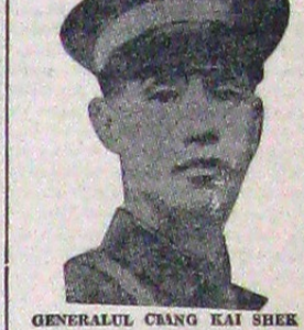
GENERALUL CIANG KAI SHEK

TOKIO, 16 (Rador). — Știri primite din Shanghai din izvor japonez, anunță că mareșalul Ciang Kai Sek, după o conferință pe care a avut-o cu toți șefii poliției chineze, a hotărât ca guvernul central din Nanking să-și mute reședința într'un alt oraș, mai spre interiorul țării.