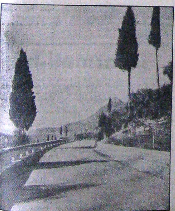
ITALIA. Soseaua spre Gargnano.