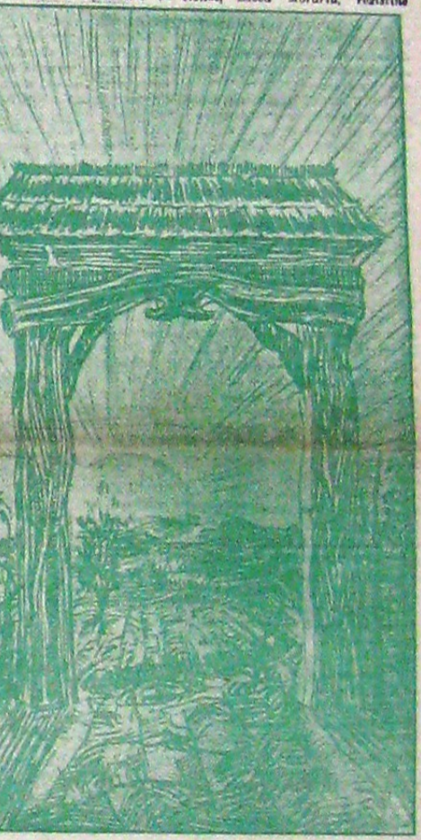
Rudolf Rybiokai Poartă țărănească din județul Cernăuți

și Fortoță — unul un bandiț, celălalt un erolin — se mai poate da lupta, de azi înainte în Bucovina... O MICA PASARE PHOENIX... JUNIMEA LITERARĂ Din conșua dezastului Nistorian în viața și cultura Bucovinei s'a