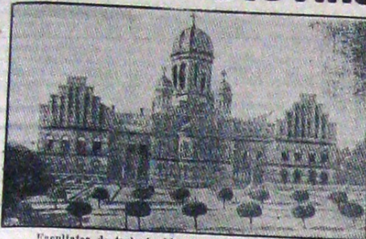
Facultatea de teologie, biserica și internatul gimnazial