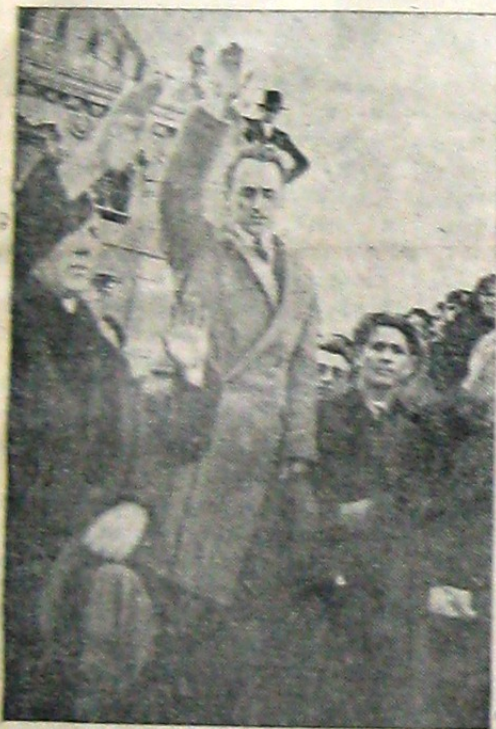
† ION MOȚA vorbind