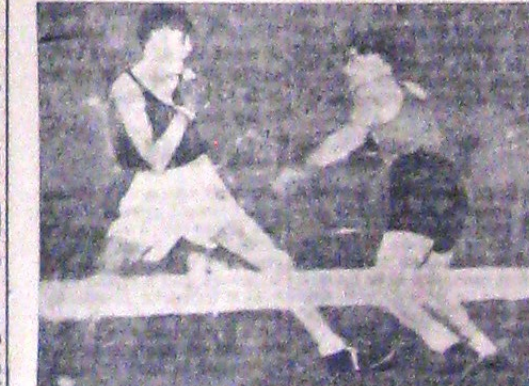
Matchurile de box amator sunt de un farmec specific ca orice întâlnire amatori. Aici se poate urmări clarul fuziune a bătăliei și profesionalității.