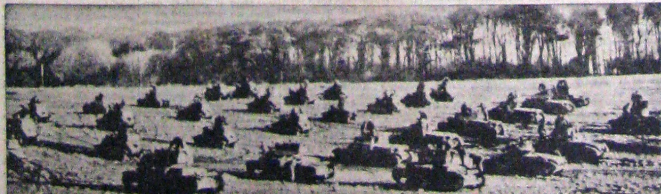
Celebrele divizii blindate ale armatelor germane care au reușit marile victorii din Polonia, Franța, Olanda și Belgia, au fost verificate și puse la ouncă pentru atacul decisiv care se pregătește. În fotografiile de mai sus, vedem o formațiune blindată în dispozitiv de pornire spre front