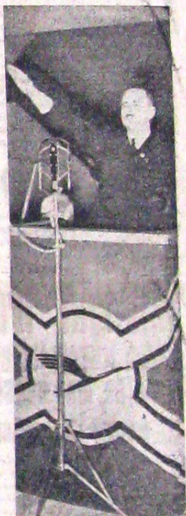
Marea societate pentru transporturi aeriene „Lufthansa” și-a sărbătorit recent împlinirea a 15 ani de la înființare. În fotografie, directorul societății Luf, după restirea cuvântării, la sedința festivă care a avut loc în acest prilej.