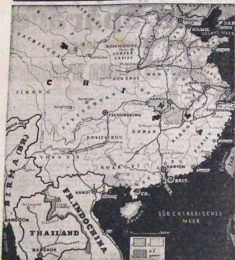
Conflictul fecut între Thailand și Indochina franceză, se menține în stare gravă. Redăm mai sus o hartă a acestei părți a lumii, în care se văd posibilitățile franceze și Thailand-ului manevrat de trupele robotului general în solda Angliei, De Gaulle