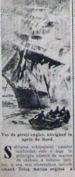
Vas de pirăți englez, navigând în apele de Nord.

Călcat în picioare și această lege, dând în nenumărate rânduri dovadă de totală lipsă de omenie și o brutalitate animalică în purtarea sa față de echipajul adversar. În nenumărate rânduri, în loc de a salva echipajul, marinarii englezi l-au nimicit cu sânge rece. Astfel în timpul războiului mondial, vasul pirateresc „King Stephen”, după ce a scufundat aeronava germană „L. 15”, a refuzat de a salva echipajul acesteia constând din comandant și 15 oameni, deși l-ar fi fost foarte ușor să facă aceasta.