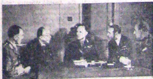
Domescăm cu acest document cădărea greco-angleză: Iată o fotografie luată cu prilejul unei sedințe a comitetului de război. Regolele Greciei este flancat de generalul englez Gambier Parry, comandantul trupelor britanice din Grecia. Mai sunt în fotografie: vice-marșalul D'Albice (englez), generalul Papagos și șeful de delegație Motaxas.