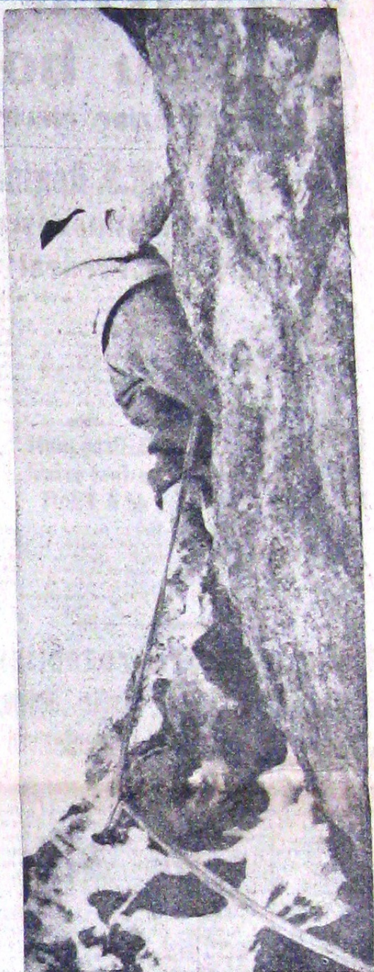
Pe frontul grec, trupele speciale alpine atacă cele mai dificile poziții. Vedem mai sus un vânător alpin, cățărându-se pe stânci pentru a instala un post de mitralieră.

Tankurile deschizătoare de drumuri pe câmpurile de luptă, sunt acum auxiliare prețioase ale agriculturii