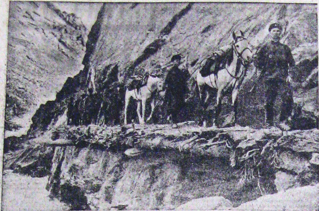
Înaintarea trupelor japoneze în China, întâmpină uneori serioase dificultăți din cauza terenului extrem de accidentat. În fotografia noastră vedem unități din trupele de recunoaștere ale cavaleriei, străbătând o poziție dificilă.