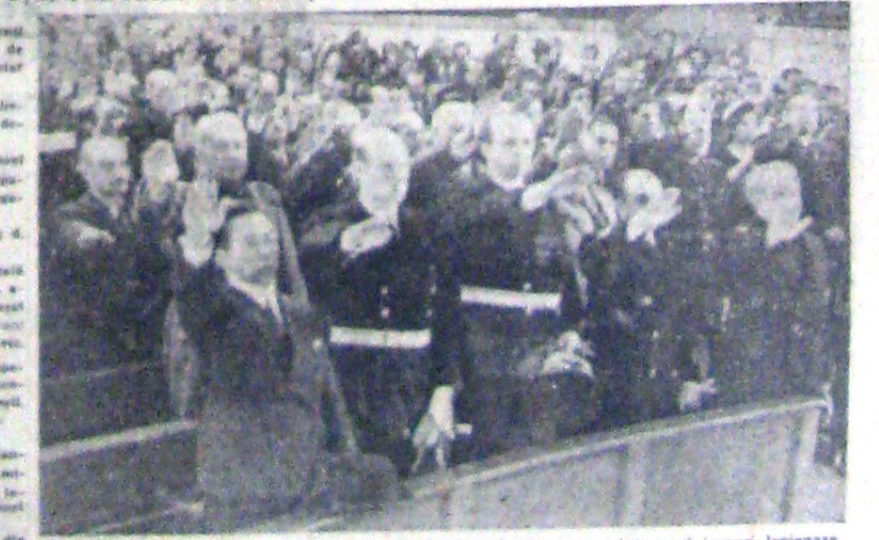
Delegațiile străine, la Facultatea de Drept din Capitală, în timp ce se întoarcă înzuri legionare