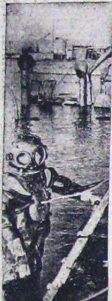
După scufundarea vaselor I-namice, scufundarii primesc misiunea de a cerceta starea e-pavelor.