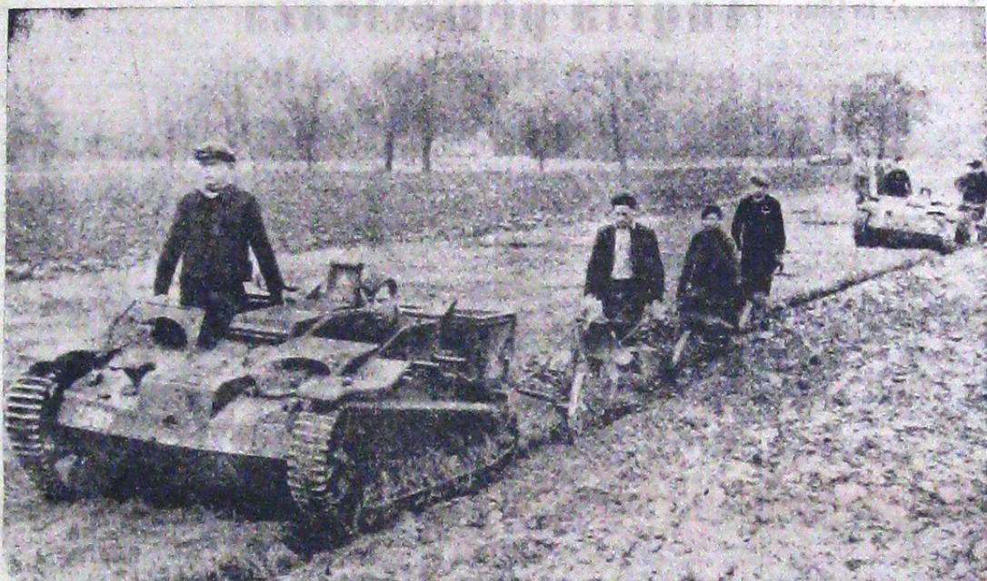
După ce au înscris paginile de glorie în cartea actualului război, tankurile armatei germane din teritoriile ocupate, au fost utilizate în agricultură, trăgând în toamna anului trecut, brazde adânci cu plugurile sănătoase ale noii așezări.