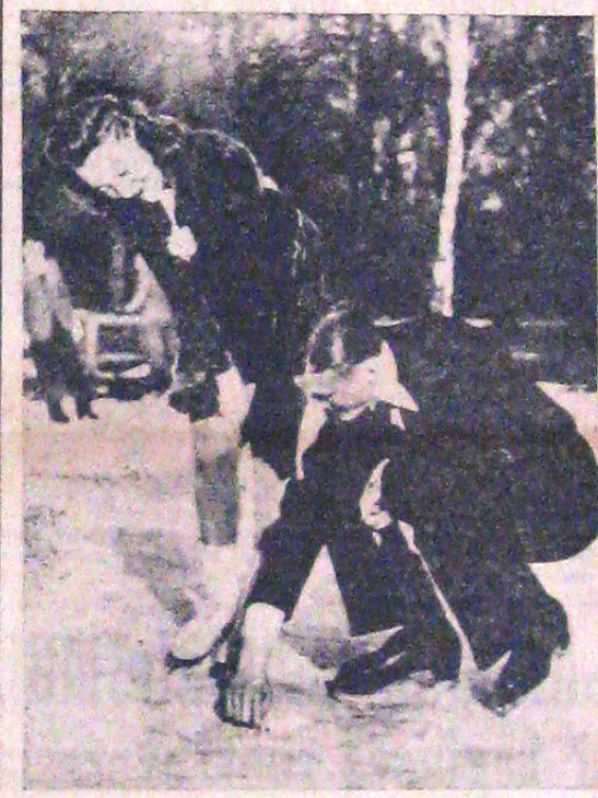
Înainte de demonstrație, „cuplul” de mai sus își schițează pe gheață figura pe care urmează să o execute

HOCKEY ELVEȚIA Zurich: Elveția-Suedia 1-0.