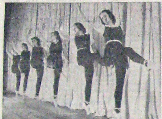
În sala de dans a Operelor de Stat din Viena, baletistele fac exerciții