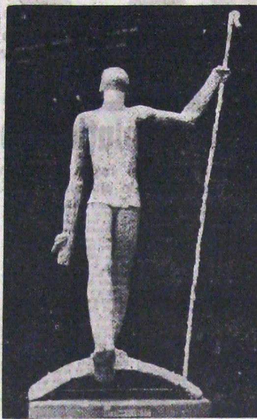
ZALMOXE de sculptorul Cristea Grossu

Profesorul va trebui deci, și nu în gândim de loc la puterea de adaptabilitate, mai mare sau mai mică, a unor membri ai corpului didactic, ci numai la acest corp so-