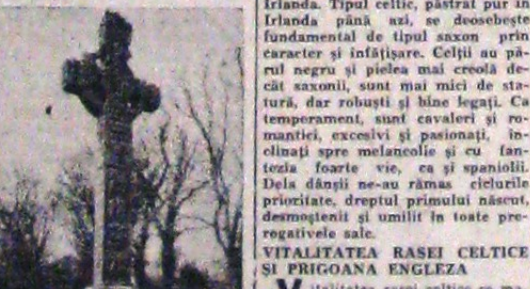
Cruceta unui eroi legendar din Ulster.

Este vorba de Irlanda, țară dărăz și încercuită de milenii, față de care vecina ei, Anglia, a comis acum ultimul act de desmoștenire.