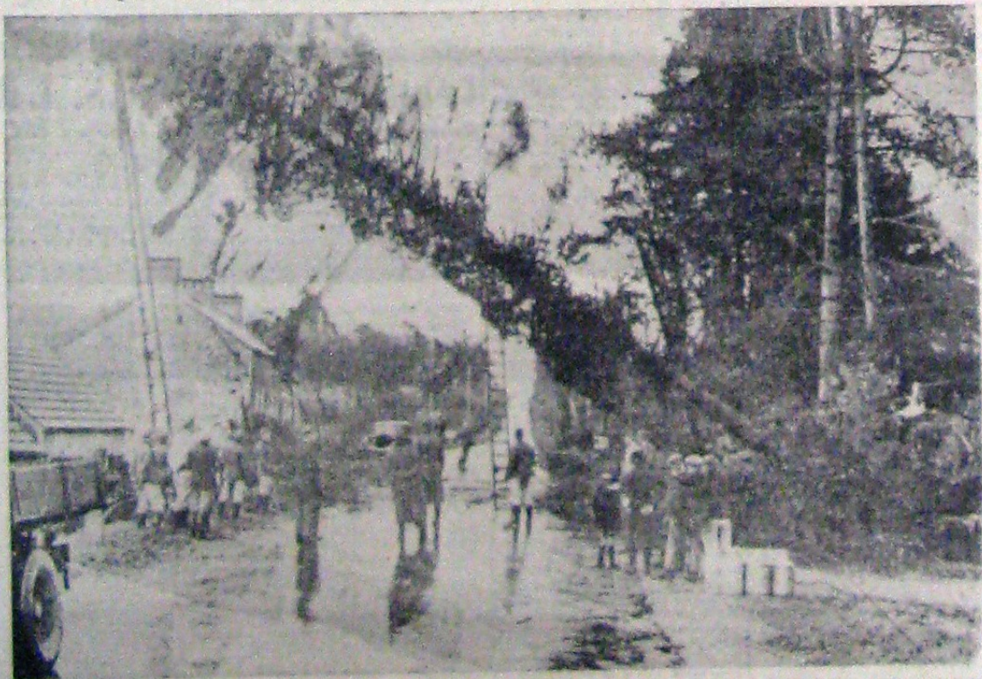
Lupta Germaniei împotriva Angliei este dusă cu toată energia. Locurile unde umșază a fi aşezate amplasamentele greilor bătălii de coastă, sunt curățate de echipe speciale, care netezesc terenul, lăsând în picioare numai pomii necesari camuflajului