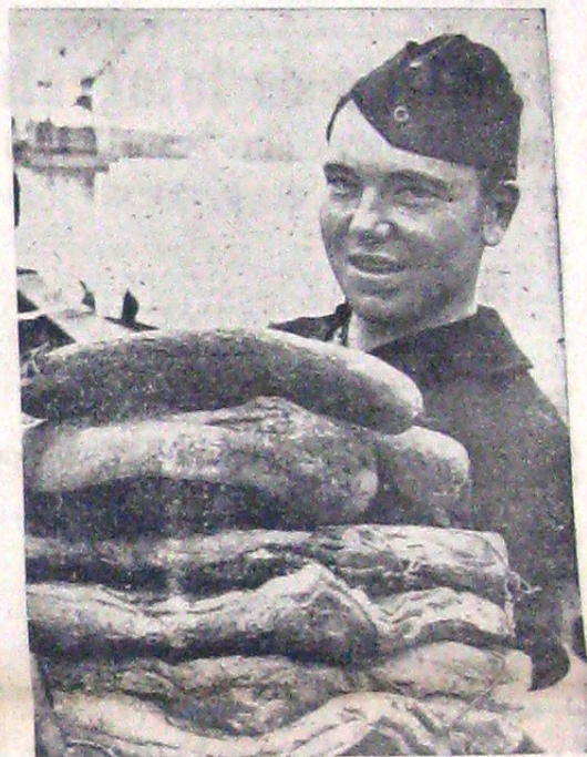
Soldatii germani aliați pe fronturile de luptă, au petrecut sărbătorile fără să simtă lipsa tradiționalei bunătați care împodobesc mesele de Crăciun. După cum vedeți mai sus, ei au avut toate aceste comestibile în cantități destul de mari