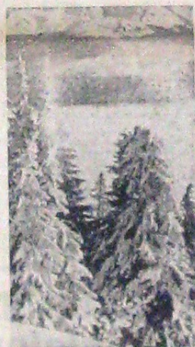
Iarna a adus și anul acesta copiilor din toate țările, bucuriile specifice vârstei și anotimpului, omul de zăpadă și caravana săniușelor, făcând acum parte din programul lor de joacă... Și în timp ce veselie s'a mutat pe povârnișurile derdelușurilor, în Cismigiu — după cum se vede în fotografia de sus — zăpada a așezat pe bănci pernile pufoase, voinădă parcă să le protejeze împotriva frigului. La munte, verdele cetinelor s'a tărcat de alb