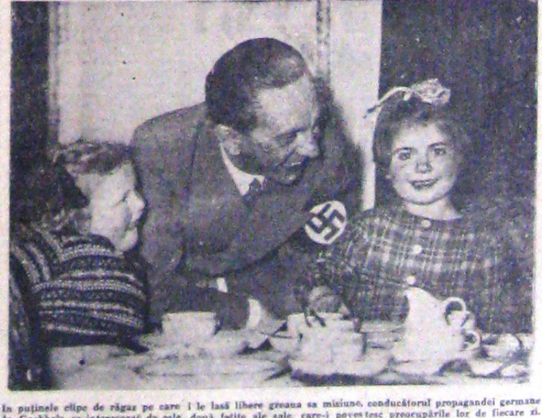
În pozele clipe de răgaz pe care i le lasă liberă greșea sa misiune, conducătorul propagandei germane dr. Goebbels, se interesează de cele două fetițe ale sale, care-i povestesc preocupările lor de fiecare zi. În fotografia noastră, vedem pe d. dr. Goebbels, urând „poită bună” drăgălașelor sale odrasle.

Un popor care a putut să procure de lucru de aproape șapte milioane de șomeri, nu trebuia în nici un caz să se sperie, că să atace în