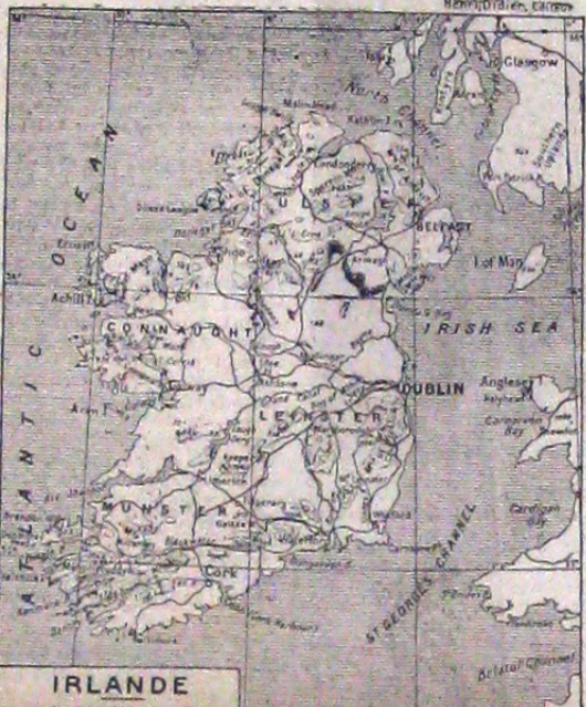
IRLANDE Reproducție interzisă