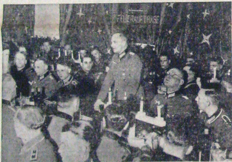
Generalul Feld-Mareșal von Brauchitsch, a petrecut sărbătorile în mijlocul soldaților. Îl vedem în fotografia noastră, rostind o scurtă alocuțiune la o masă camaraderescă