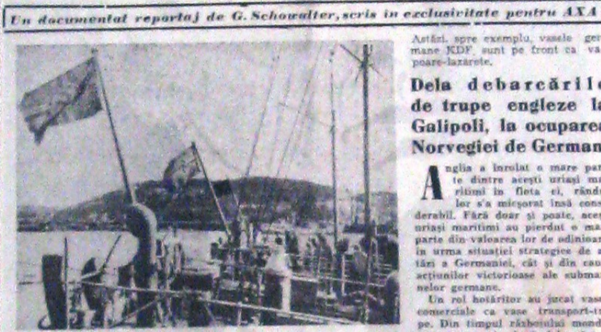
Un vas german de comerț transformat în vas de război, care a participat la campania din Norvegia

Una dintre caracteristicile momentului istoric pe care îl trăim, este încrederea pe care o fac națiunile de a se cunoaște îndeaproape, pentru stabilirea unui echilibru real între ele.