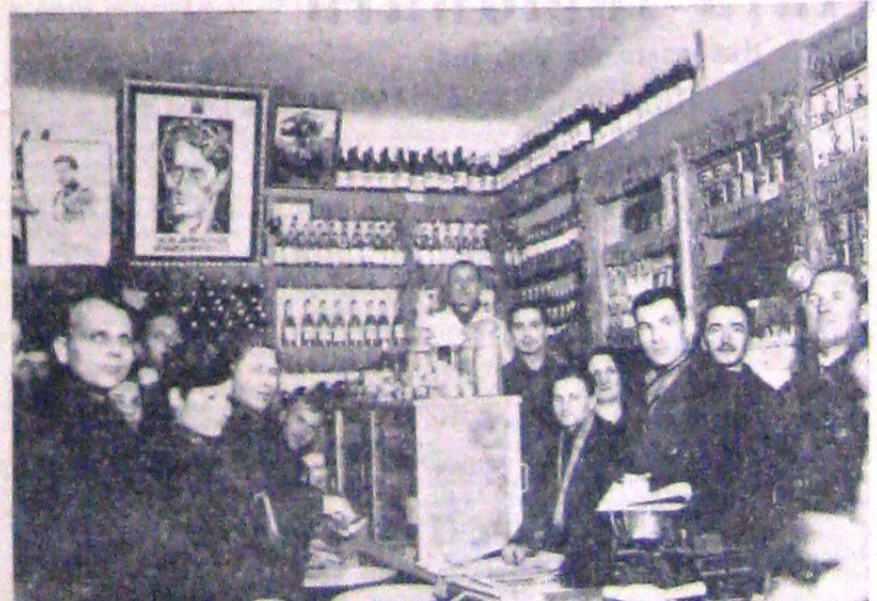
Eri s'a inaugurat in Capitală — in cartierul Bellu — noua cooperativă legionară „Viața noastră” din inițiativa grupului V.