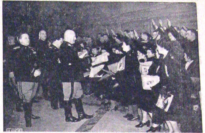
Ziua Mamei și a copilului a prilejuit în Italia impresionante manifestații. In Palazzo Venezia, Ducele a participat la o mare serbare, împărțind daruri mamelor și copiilor cari i-au făcut o caldă manifestație.