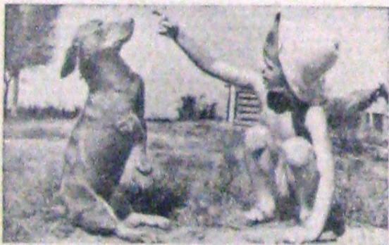
Iarna a strâns copiii de prin păcuri și de pe pașuni, oprindu-i pentru câteva luni să mai sburde în voe. Cei doi buni tovarăși de joacă pe care-i redăm mai sus, se regăsesc acum unul pe altul...