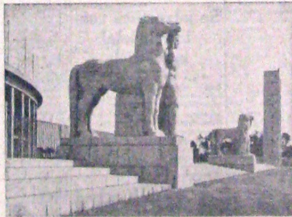
In sala de expoziții a Cancelariei Reichului, sunt expuse interesante lucrări de sculptură. Iată un aspect al unui colț din această sală.