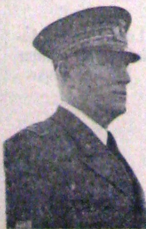
Amiralul Iachino, comandantul forțelor navale italiene.