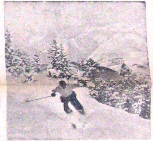
In munții sporturile albe se practică pe o scară înaltă, skiorii dând dovadă de mult curaj în coborirea pantelor cele mai periculoase.