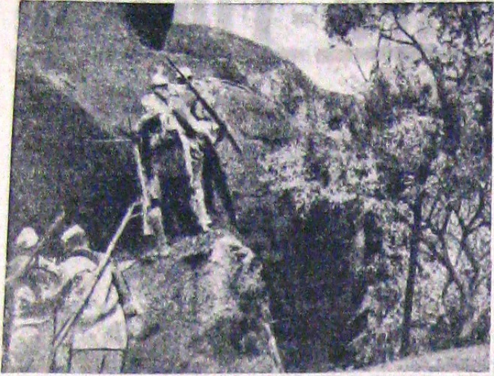
In zona Kenya unde au avut loc lupte grele, trupele italiene au pus stăpânire pe fortul Harrington de lângă Molale, unul din puternicele bastioane de rezistență ale Englezilor. In fotografia noastră, jos, se vede această cetățuie pe care englezii o credeau inexpugnabilă, având pe turn drapelul Italiei fasciste.