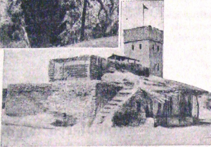
SUS se văd soldații italieni făcând de straje pe meterezele fortului.