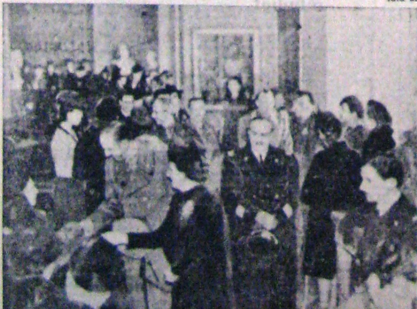
Principele de Piemont a vizitat zilele acestea o frumoasă expoziție organizată în folosul copiilor soldaților italieni aflați pe front.