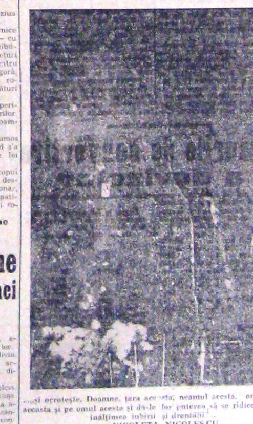
Crucea de pe locul unde a fost ucisă Nicoleta