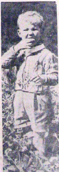
Victor Emanuel, fiul principelui moștenitor Umberto, este un copil ca toți ceilalți. Îi place jocul mai ales în mijlocul naturii. Frivill-i cu căta poștă mănâncă după o zi de alergătură.