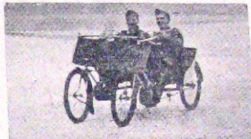
Consumul rațional al benzinei în Germania nu lipsește pe cel ce n'au posibilitatea să și-o procure, de anumite plăceri. Ostașul german e ingenios. În lipsa de automobil cei doi soldați din clișeu nostru și-au construit un alt vehicul pe patru roate ce poate fi mișcat cu ajutorul pedalelor. Efortul îl fac amândoi ocupanții numai conducerea fiindu-i rezervată unuia singur.