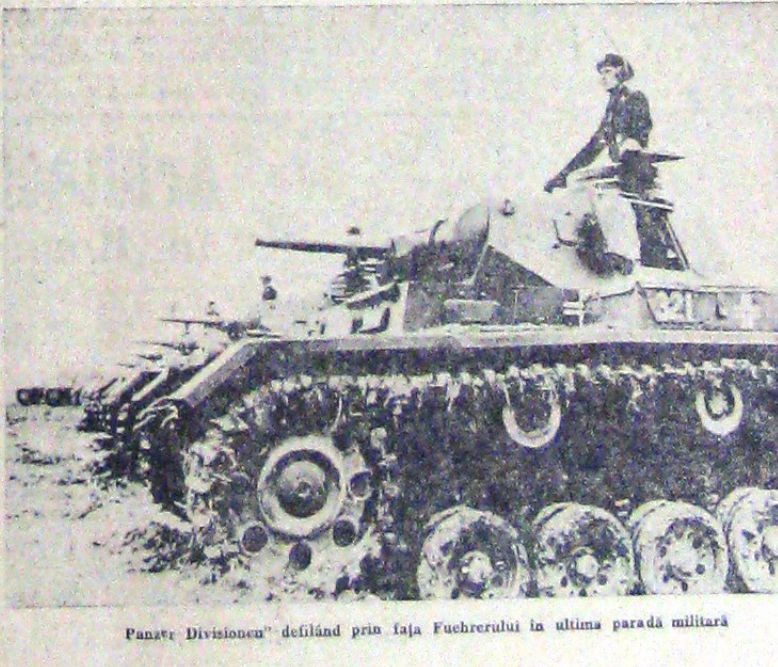
Panzer Divisionen" defilând prin fața Fuehrerului în ultima paradă militară