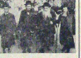
Tipul specific al jidovului din ghetto

Tipul specific al jidovului din ghetto... grom adevărat, care trebuia să facă să curgă în râuri sângele curat la frunțașii unei întregi generații. O conferință ministerială, prezidată de Mareșalul Goering, a hotărât noua sancțiuni. S'a interzis evreilor de a mai intra în vre-un local public: teatru, cinematograf, cafeana, restaurant, etc.; de a avea automobile, de a locui în anumite cartiere, de a circula pe anumite străzi. În mod solidar, au fost condamnați la plata unei amende de un miliard de mărci și la scoapieră cheltosilor făcute cu repararea străzilor și curățenia comise cu prilejul manifestațiilor. Cu începere dela 1 Ianuarie 1939, evreii n'au mai avut dreptul să facă comerț, să practice meseriile sau să participe într'o formă oarecare la vre-o întreprindere comercială sau industrială. Adăugate la legea dela Nuernberg, aceste măsuri statorniceau definitiv situația evreilor în Germania. Pentru a stabili modul în care evreii trebuiau să plătească amenda de un miliard de mărci, auto-