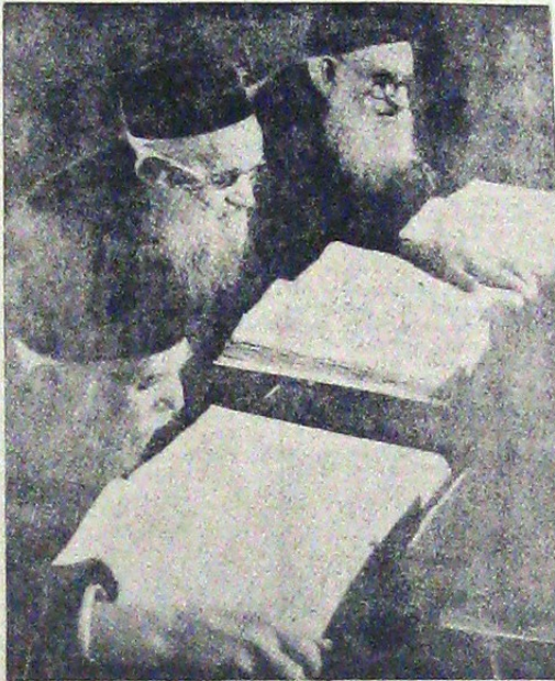
Jidovi bătrâni citind talmudul

ribțiile au făcut un recensământ al evreilor bogăți. S'a constatat că numai în Berlin trăiau 894 de evrei cu averi de peste 300.000 mărci - 15.000.000 lei - 346 cu peste 500 de mii mărci; 199 erau milionari în mărci; 37 aveau peste 2 milioane