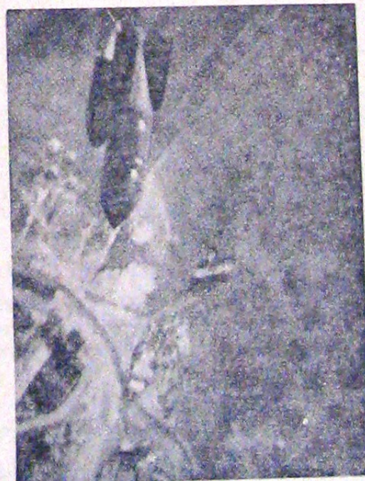
Succesele aviației germane se datoresc în bună parte — pe lângă pregătirea temeinică a piloților — schimbării tacticii de luptă, înainte de a putea lua înamicul vreo măsură dic-tată de experiență. După bombardamentul în picaj al cărui efect — se știe — este formidabil, s'a adoptat bombardamen-tul razant, care dacă nu este așa de precis ca celălalt are marele avantaj că surprinde pe înamic. Avionul atacă de data aceasta dela înălțimi foarte mici după care dispare fără a putea fi alina de artileria antiaeriană, pregătită pentru tra-gere la distanță. Iată în fotografie aceasta o demonstrație de acest fel. Avioanele care se aflau pe aerodromul atacat nici n'au avut măcar timpul să se ridice dela pământ până ce înamicul a dispărut.