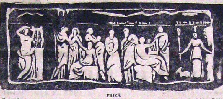
Gravură FRIZA de Cristina Grossu