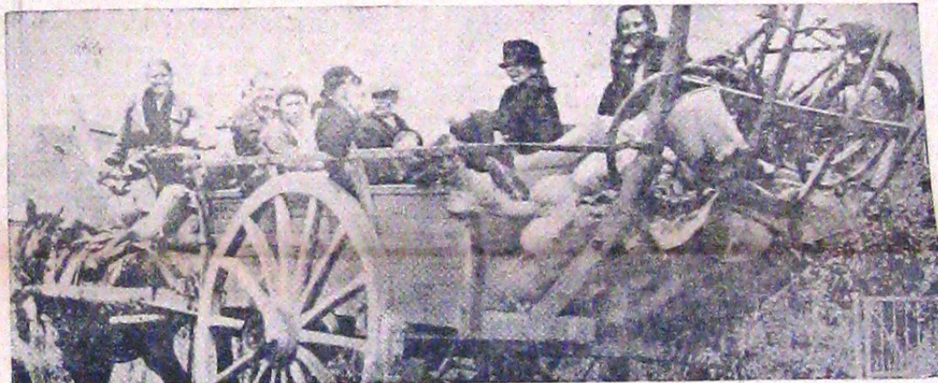
Deși a trecut destul timp dela terminarea războiului franco-german mai sunt totuși refugiați cari au întârziat să se înapoieze la căminul pe care l-au părăsit în grabă cu ce au putut. Iată membrii unei familii pe laja cărora se citește fabricarea de a-și putea revedeia locurile atât de scumpe lor.