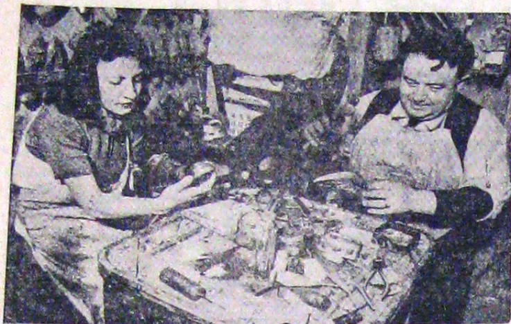
In lipsa lucrătorului plecat pe front, soția l-a luat locul. Desigur că se bucură de un regim mult mai „dulce” decât calfa, deși se află în perioadă de ucenicie. După cum se poate vedea în fotografie, patronul pare să fie încântat de tovarășia aceasta.