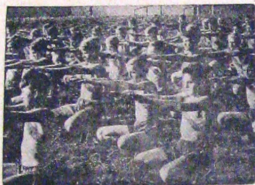
Tinerii de mai sus sunt lucrători în uzinele Messerschmidt. Bine pregătiți, dau în materie de muncă același randament pe care-l punea de lucrătorii mai vârstnici. Industriștii Messerschmidt se mândresc cu această armată de tineri și poartă o deosebită grijă pentru sănătatea lor. În fiecare zi le rezervă ore de educație fizică sub conducerea unui specialist.