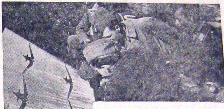
O victorie aeriană se împarte întotdeauna între pilot și mitralier. Și unul și celălalt sunt temeinic pregătiți. Ostașii din clișeu nostru cercetează efectul unui exercițiu de tragere cu mitraliera, într'un panou mobil pe care este desenat un avion așa încât exercițiul să capete cât mai mult un aspect de realitate.