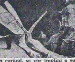
În curând, se vor împlini o sută de ani de la primele încercări de zbor fără motor.

În clișeu, un aparat de pe vremea eroicelor încercări ale tineretului german de a se urca spre cer.