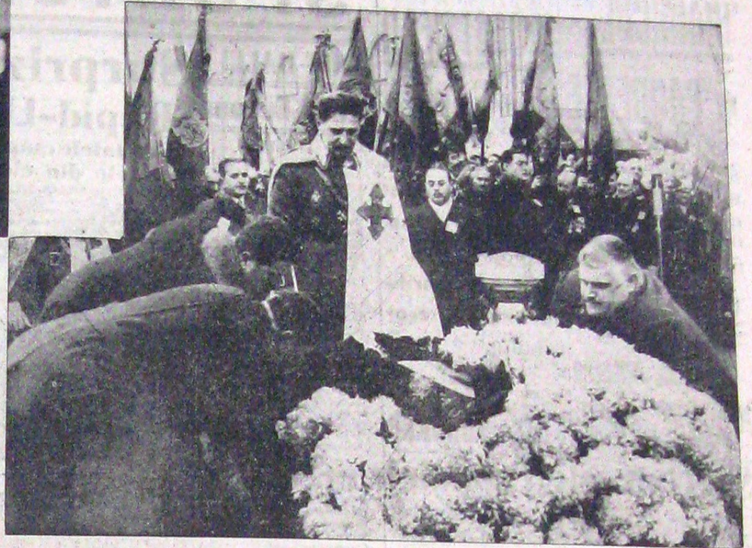
Capitala a cunoscut ieri una dintre cele mai grandioase manifestații de solidaritate națională. La mormântul Eroului Necunoscut au venit să se închine ieri toți foștii luptători în războiul pentru întregirea neamului. În clișeul de sus o delegație depune o coroană de crizanteme albe, omagiu pentru jertfa celor căzuți la datorie.