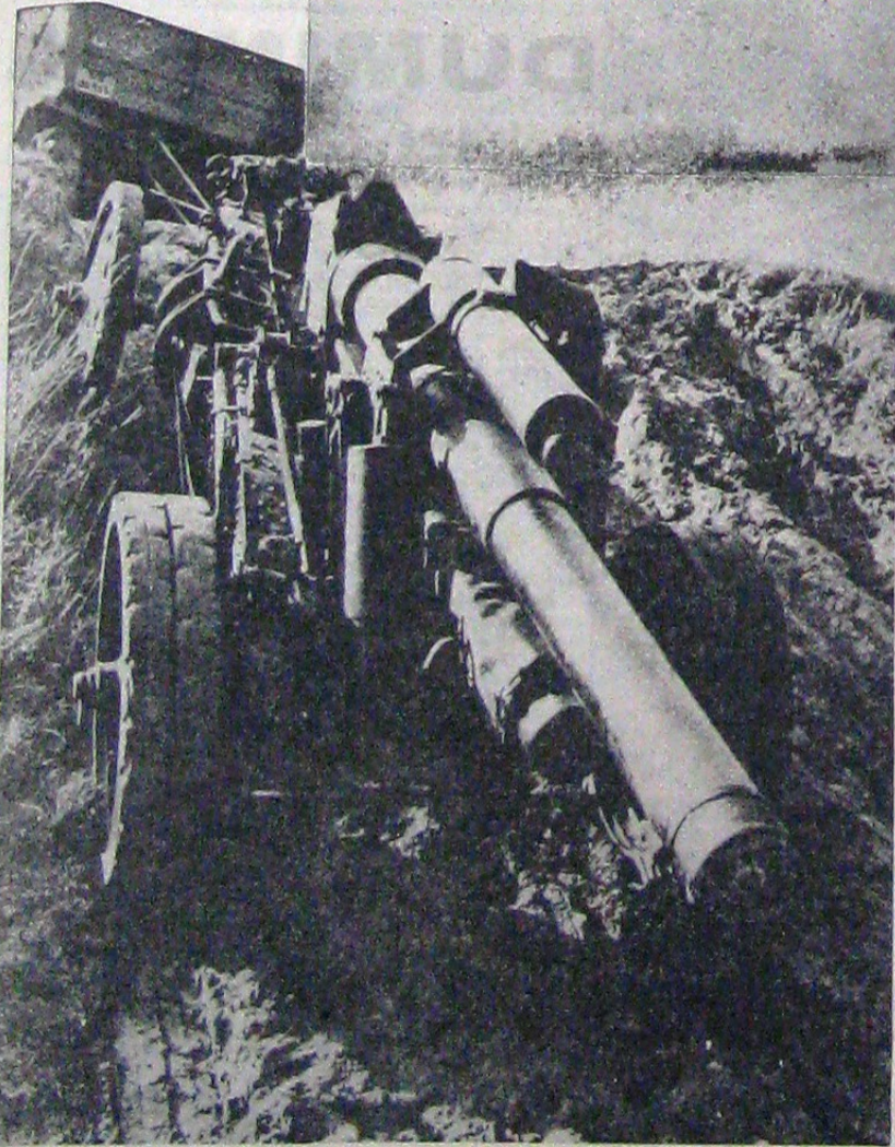
Războiul de-acuma nu știe ce înseamnă obstacol natural. Armamentul greu poate fi folosit acolo unde se simte nevoie de el și aceasta se petrece cu mare rapiditate. Iată în fotografia noastră un obuzier italian care „sue la creastă”, tras de un tractor. Toată operația aceasta nu durează mult. În mai puțin de un sfert de oră poate fi pus în bătaie.