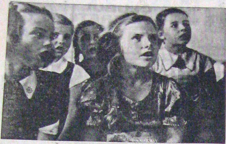
În Salzburgul lui Mozart, orașul muzicii, există o Academie muzicală în care se cultivă talentul tuturor copiilor ce au acest geniu. Studiile sunt formate în majoritate din bucățile lui Mozart. Fotografia noastră l-a surprins în plină activitate pe viitorii mari muzicieni.