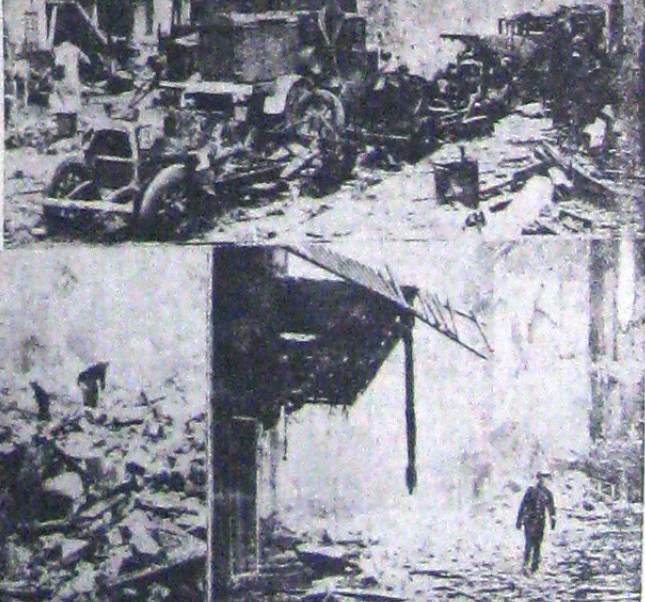
Privești din Londra de azi, umbră a ceea ce era până de curând centrul finanței internaționale jidovești