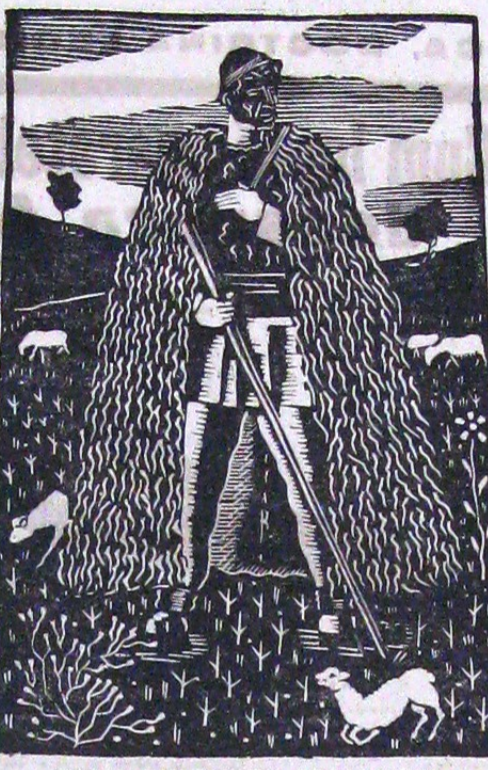
MOCAN DIN MUNȚII BRAȘOVULUI de Alexandru Bassarab Gravură

Așa s'a ajuns la viața noi, ca și în alte părți la situația tragic-comică