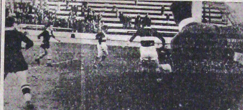
Panică la poarta echipei Mica. — Arbitrul este la post și urmărește atent. Mai atent decât jucătorii

Rezultatele etapei a 12-a sunt in rest normale, desi unele din ele par a fi exagerate ca scor