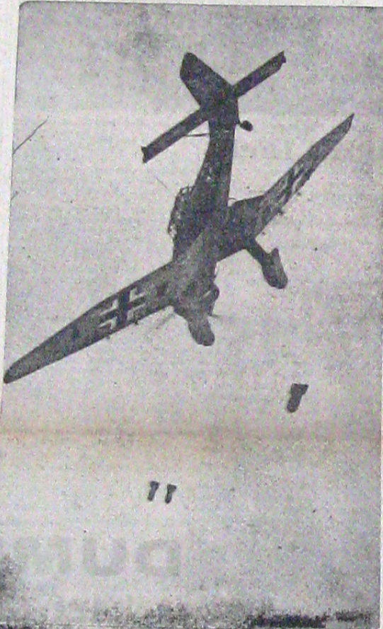
Aparatele „Stuka” își au istoria lor. Dotate cu aparate de vizibilitate dintre cele mai moderne își reperează ținta dela mari înălțimi după care coboară în picaj lovind obiectivul în plin. Iată instantaneul unei manevre desăvârșite.