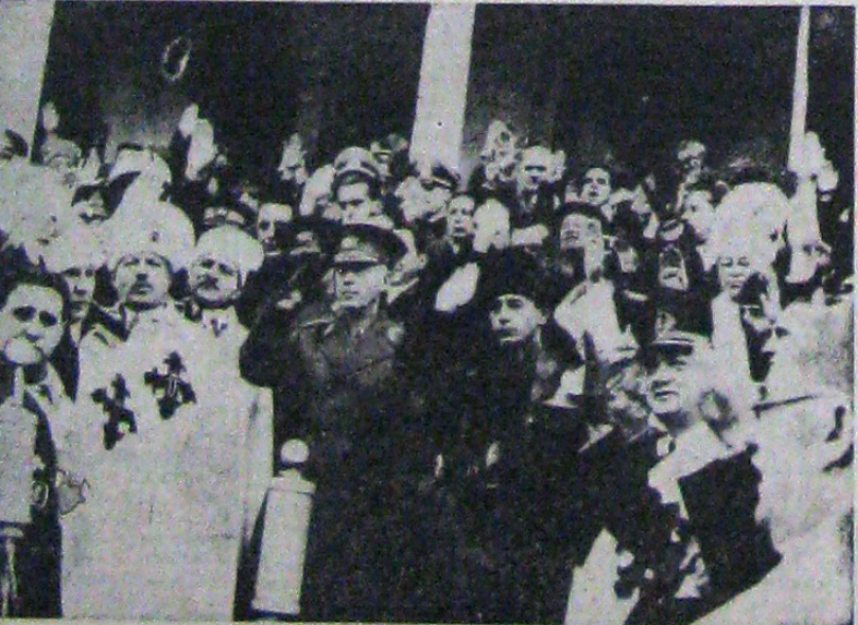
D-nul general Antonescu și Heria Sima, primind defilarea celor cari și-au dat sângele pentru România Mare (Reportajul în corpul starului)