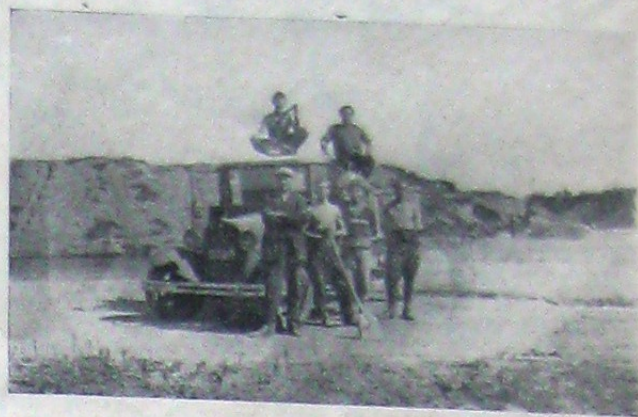
Camioneta „Oltenia” a legionarilor olteni, cărând pietris.