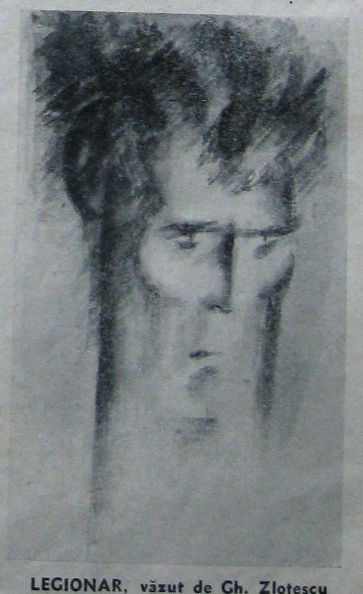
LEGIONAR, văzut de Gh. Zlotescu