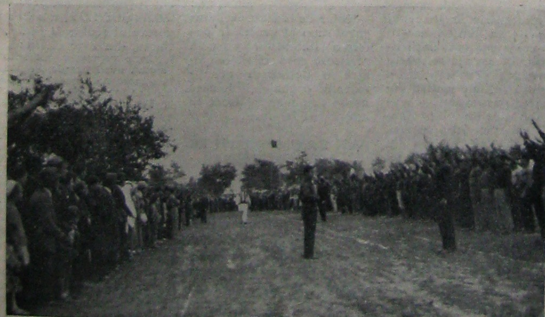
Serbarea înălțării zidurilor. Sosește Căpitanul.