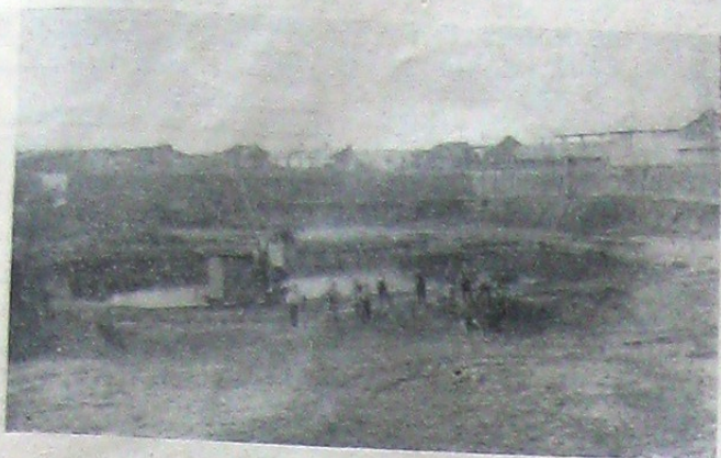
Vederea generală de la Căramidărie

Zi de zi, sub supravegherea admirabilului arhitect Iofu, se ridică din pământ mândra și frumoasa casă a legionarilor răniți, casa bucuriei și a biruinței noastre!