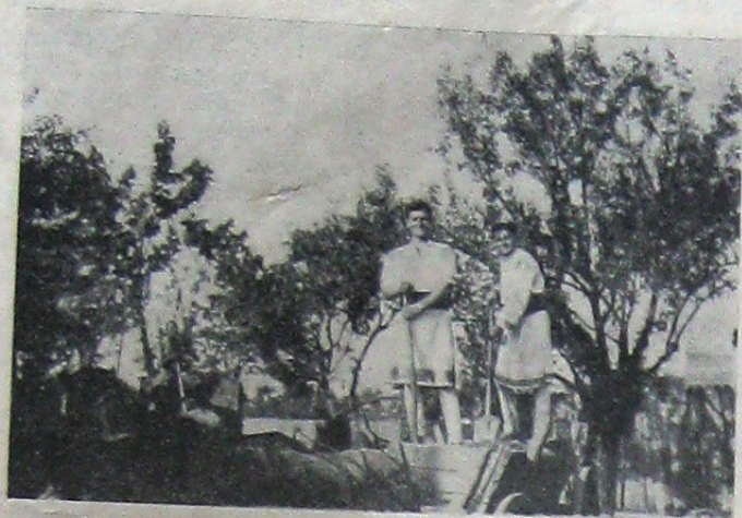
Doi legionari, studenți bucovineni, descărcând pietris.