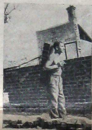
Legionar cărând cărămidă